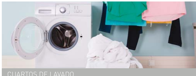
CUARTOS DE LAVADO